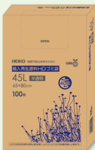
① 45L #006605400 ② 70L #006605401 ③ 90L #006605402