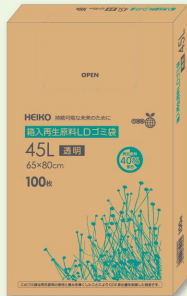
④ 45L #006605500 ⑤ 70L #006605501 ⑥ 90L #006605502