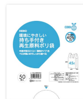
④ 45L #006604053