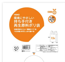
① 15L #006604050