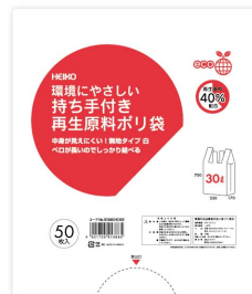
③ 30L #006604052