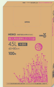
⑦ 45L #006605550 ⑧ 70L #006605551 ⑨ 90L #006605552